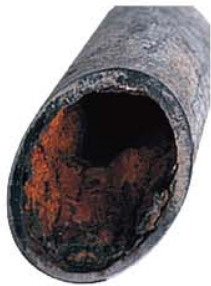
築50年の一般住宅の(水道管内をファイバースコープで撮影)例